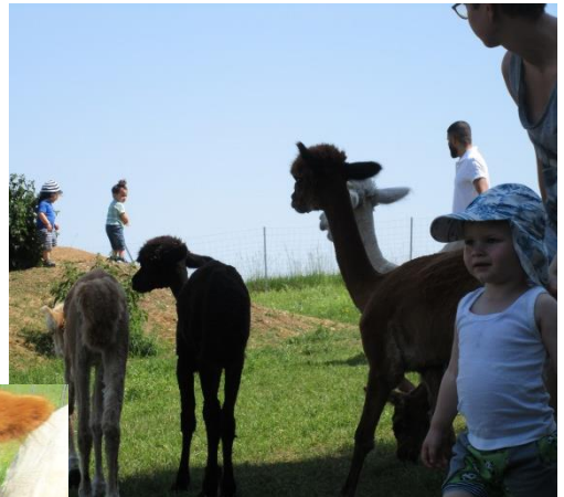
Besuch bei den Alpakas