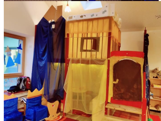
die rote Gruppe

Selbstverständlich können die Kinder die ganze Woche verkleidet kommen.